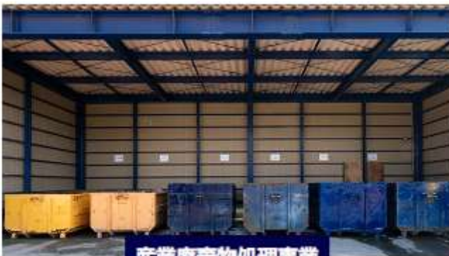
産業廃棄物処理事業