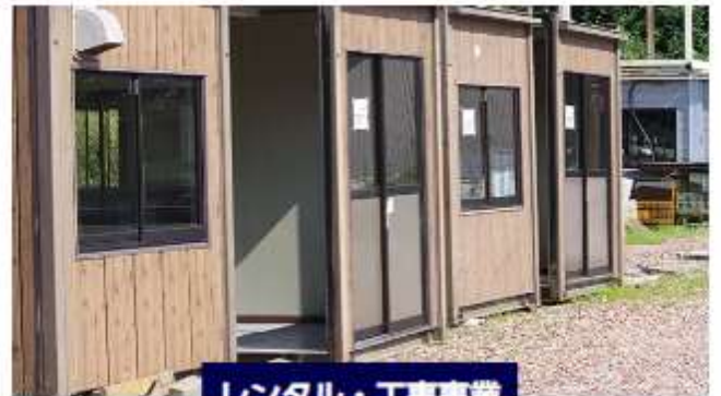
レンタル・工事業