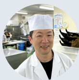
Yさん 2024年3月入社 (副料理長)

和食の原点を追及しようと、地元の旬の素材を手作りで、独自の料理に仕上げています。生産者の皆さんとの距離が近くなったことで、生命力にあふれた自然の恵みと地域への感謝がより強くなりました。昔のようなしがらみがない、他部門との壁もない明るい職場を作ります。富山の幸で腕をふるいたい方を募集します。