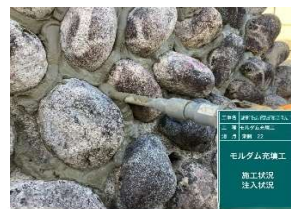
モルダム工法による石積みの補修