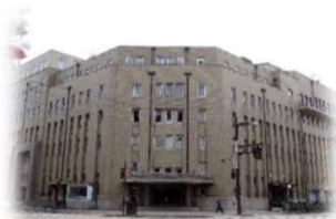
富山市桜橋通り 電気ビルディング本館3階