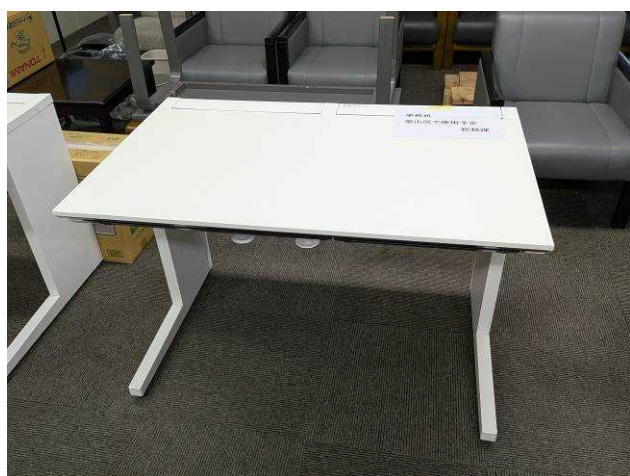
助成金センター平机（6 台）