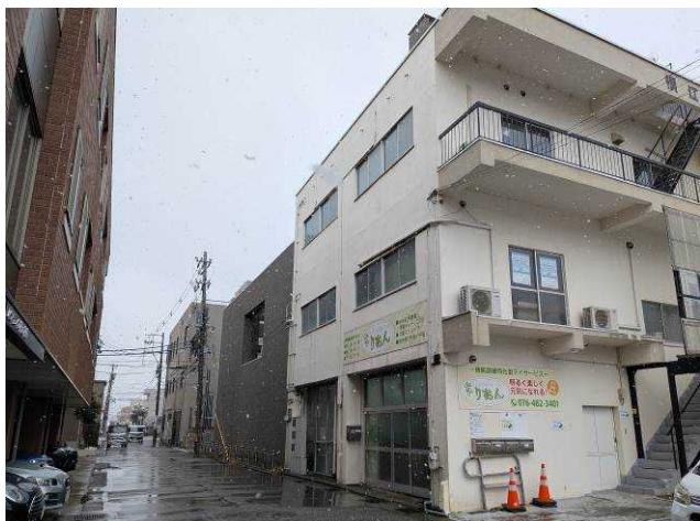
横江ビル前面道路