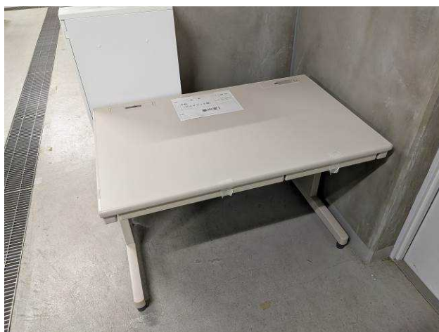
熱源機械室平机（1 台）