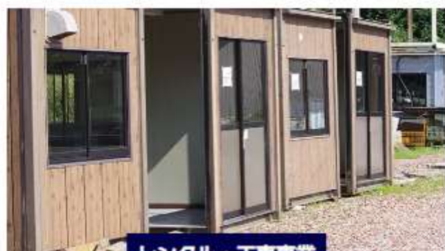
レンタル・工事業