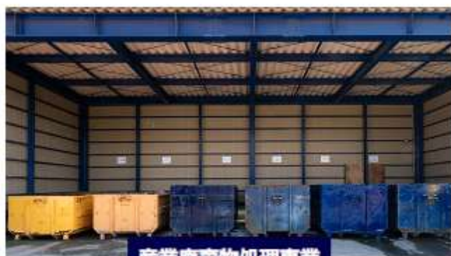
産業廃棄物処理事業