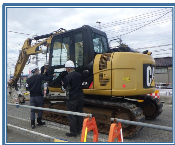
建設荷役車両安全技術協会富山県支部とのパトロール