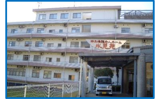
5階建ての広々とした施設です