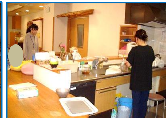
温かいご飯やみそ汁を提供