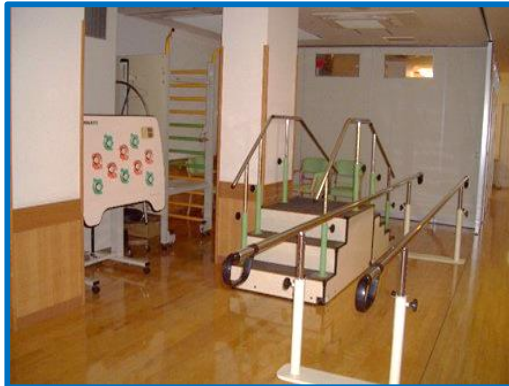
機能訓練員や看護師が訓練指導実施