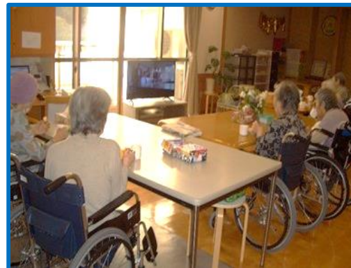
ユニット内でのおやつタイム