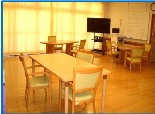
デイサービスのゆったりしたフロア