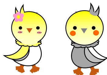
ハローワーク滑川公式キャラクター 「きなことりく」