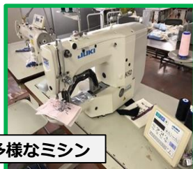
多種多様なミシン