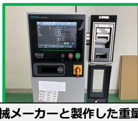
機械メーカーと製作した重量チェッカー