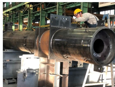
建築用鉄骨柱 製作工程