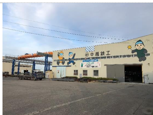
旧工場(鉄骨梁の製造加工)