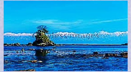
富山湾越しに見える立山連峰