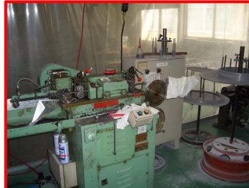
線材加工：金属線の切断