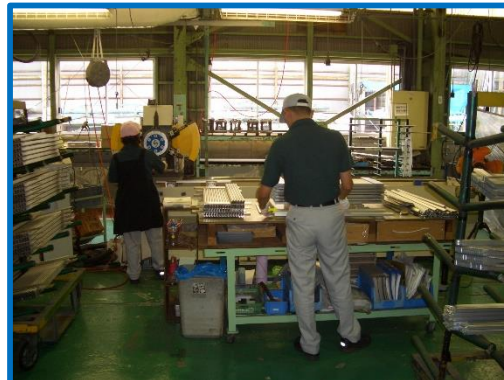
アルミ建材の組立