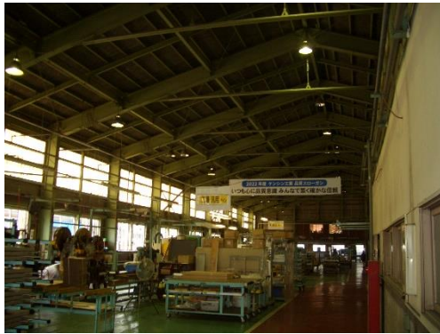
工場（工場は2棟あります）