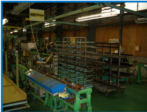
アルミ建材の加工（穴あけなど）