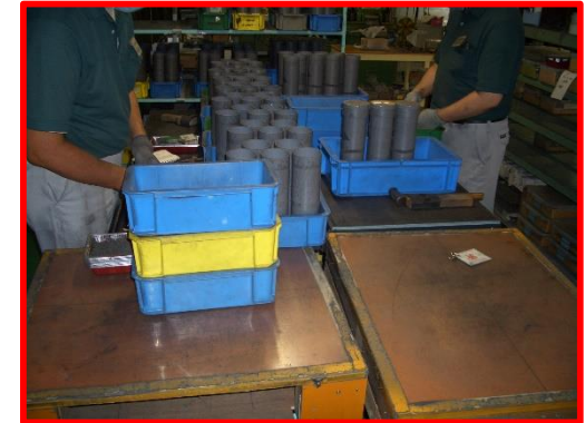
線材加工：機械での研磨後、 仕上がった製品の取り出し