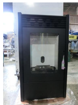
自社製品のエコティ PS302-S