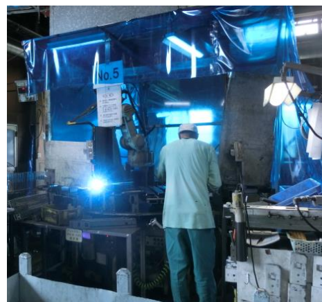
ロボット溶接作業中