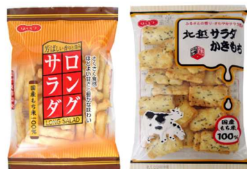
(左からロングサラダ・北越サラダ)