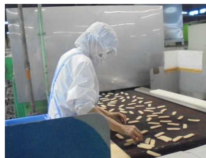
生地を並べる仕事