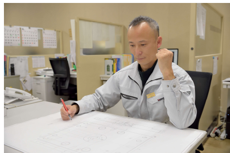
金型設計 (2DCAD, 3DCAD)