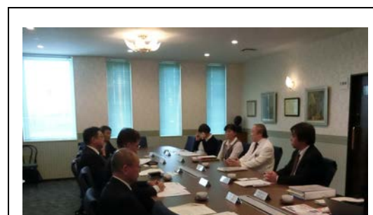
視察後のフリーディスカッション