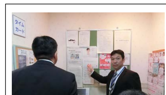
現場視察（企業担当者による説明）