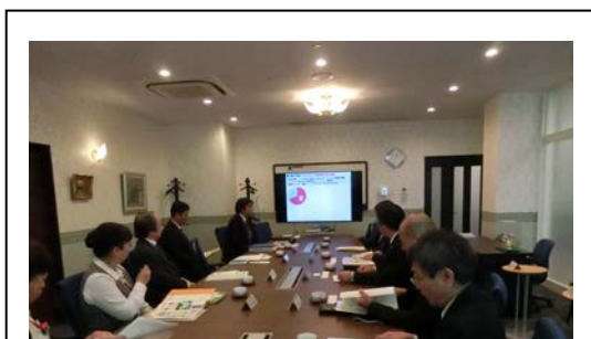
企業からの取組内容説明