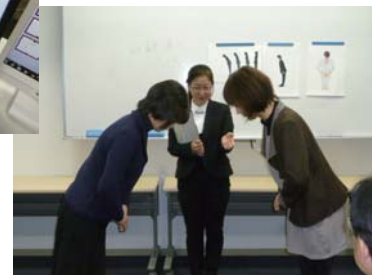
ビジネスマナー演習