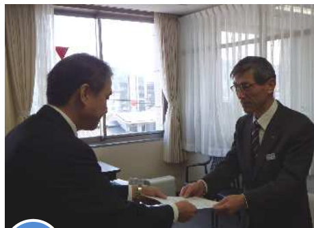
3/5 鳥取県商工会議所連合会