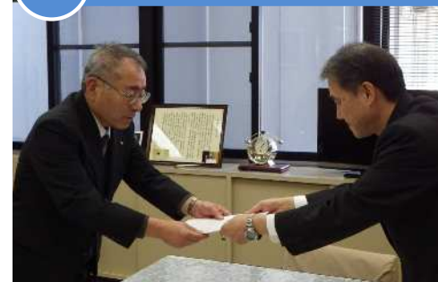
▲ 川口専務理事（左）へ要請を行う 大路部長（右）