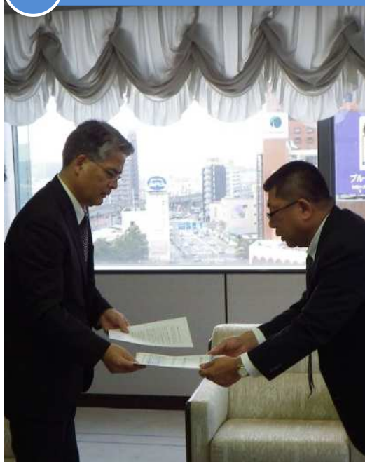
3/4 鳥取県経営者協会