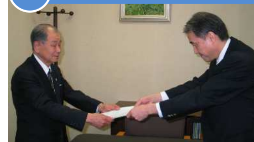
▲ 本池会長（左）へ要請を行う 大路部長（右）