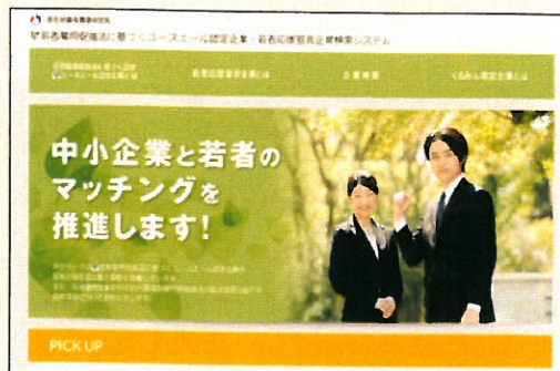
「ユースエール認定企業・若者応援宣言企業検索システム」

個別企業ごとに企業概要、雇用管理の状況、求職者に向けたメッセージなどを掲載することで、積極的な企業情報の発信と若者とのマッチングを促進していきます。