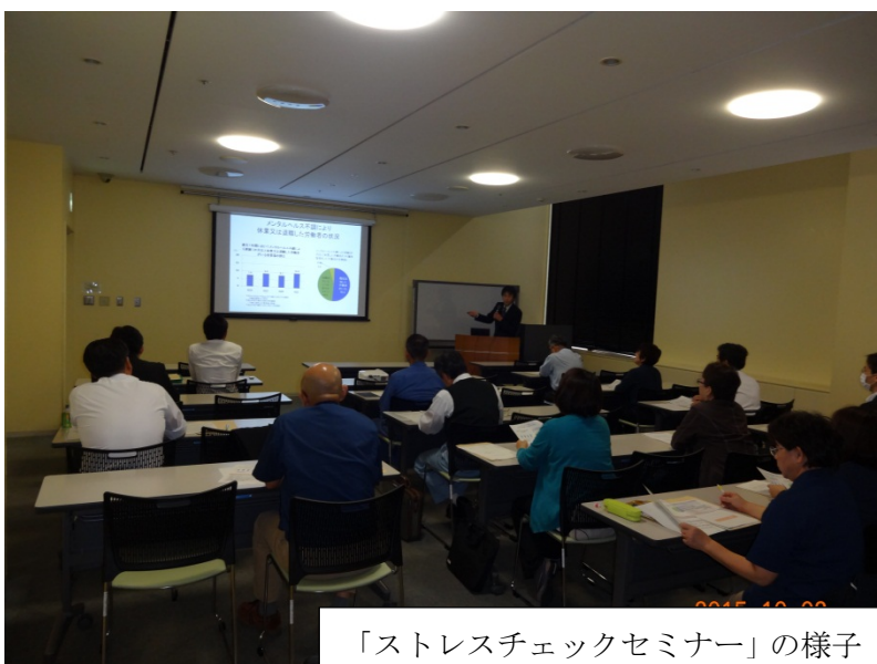
「ストレスチェックセミナー」の様子

「ストレスチェックセミナー」では、2会場で 191 人の方に参加いただきましたが、今回も定員を上回る参加希望があったので、平成 28 年 2 月