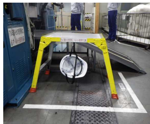
ヘルメットを備えた踏み台