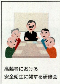
高齢者における安全衛生に関する研修会