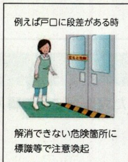
例えば戸口に段差がある時