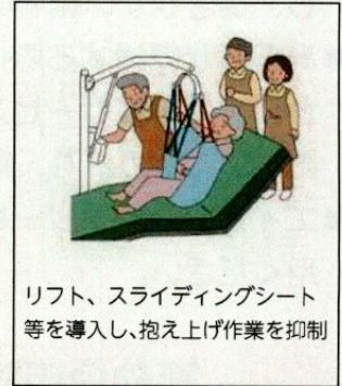
リフト、スライディングシート等を導入し、抱え上げ作業を抑制