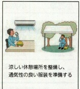
涼しい休憩場所を整備し、通気性の良い服装を準備する