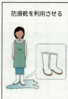
防滑靴を利用させる