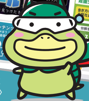
アルバイトの労働条件を確かめよう！ キャラクター〈たしかめたん〉