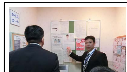
現場視察（企業担当者による説明）