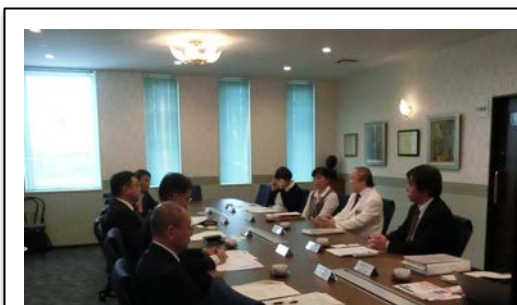
視察後のフリーディスカッション