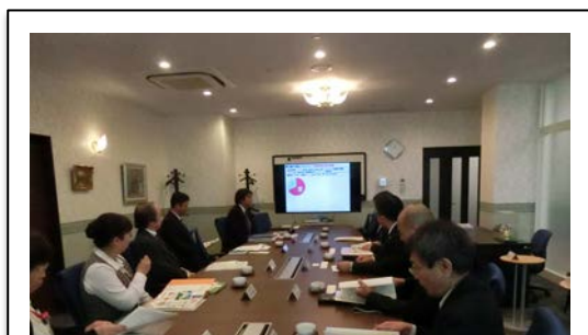
企業からの取組内容説明