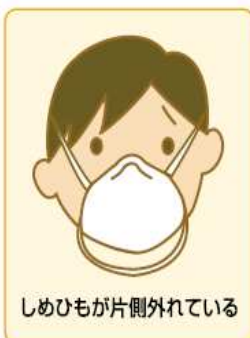
しめひもが片側外れている