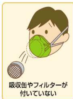
吸気弁やフィルターが 付いていない