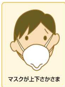
マスクが上下さかさま