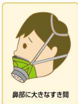
鼻部に大きなすき間