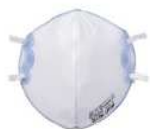
使い捨て式防じんマスク

がれきの粉じんには石綿が含まれているおそれがあります。事業者の指示に従い、適切なマスクの着用をお願いいたします。