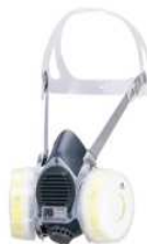
取替え式防じんマスク