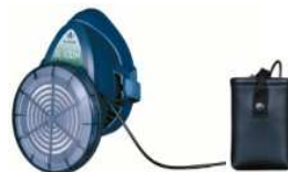
電動ファン付き呼吸用保護具