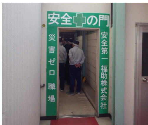
作業場入口の「安全の門」