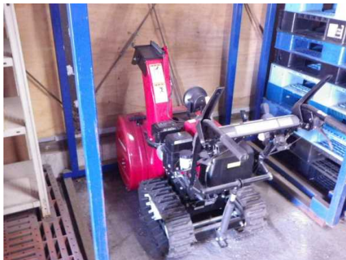
出番を待つ除雪車