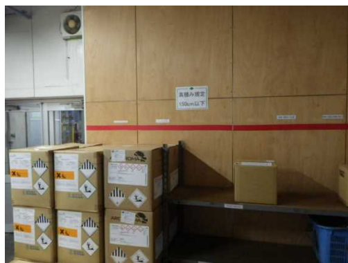
荷積みの高さ制限表示