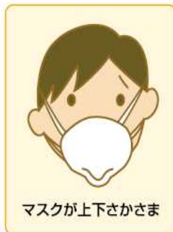
マスクが上下さかさま