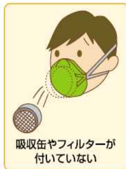
吸収缶やフィルターが付いていない