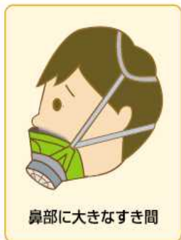
鼻部に大きなすき間