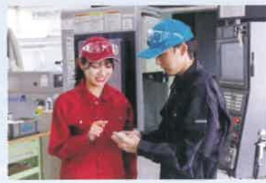
マシニングセンタ作業