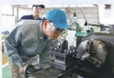
旋盤及びフライス盤作業