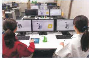
3次元モデル作成作業