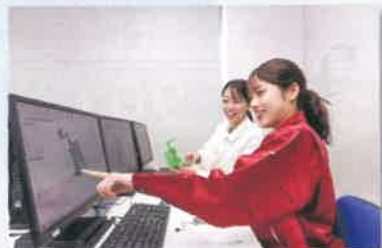
機械製図及びCAD基本