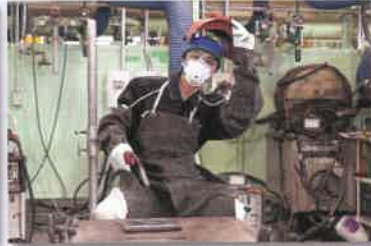
ガス溶接・炭酸ガスアーク溶接