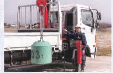
クレーン・玉掛け作業