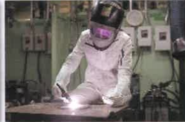
TIG (ティグ) 溶接