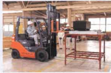
フォークリフト作業