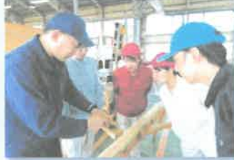
材料の知識と部材の加工