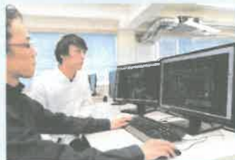
パソコンを使った図面作成