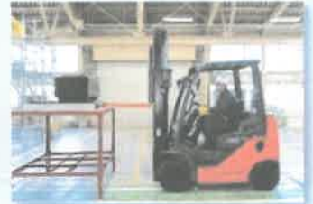
フォークリフトの運転技能講習