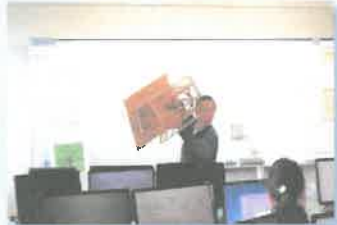
住宅の構造や法律など