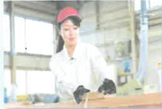
手工具・電動工具の使い方