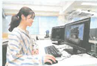
立体モデルの作成とプレゼン