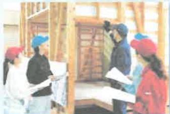
木造住宅の外装内装工事