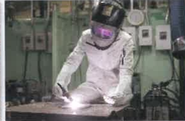
TIG (ティグ) 溶接