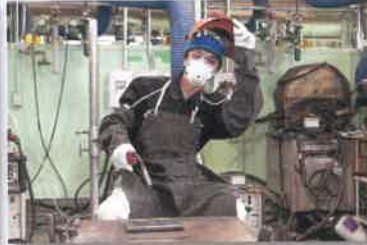
ガス溶接・炭酸ガスアーク溶接