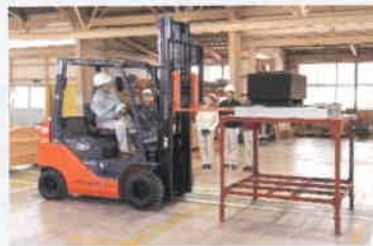
フォークリフト作業