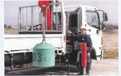
クレーン・玉掛け作業