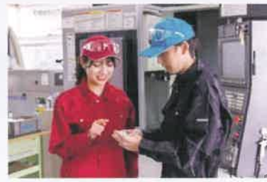
マシニングセンタ作業