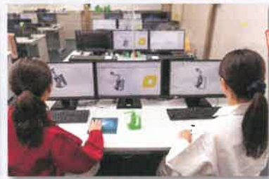
3次元モデル作成作業