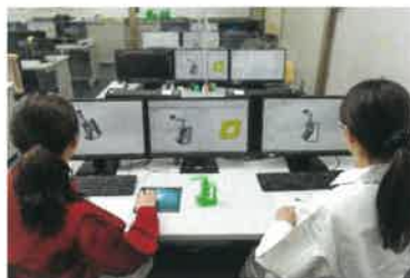
「CAD」というパソコンソフトを使って部品を設計します