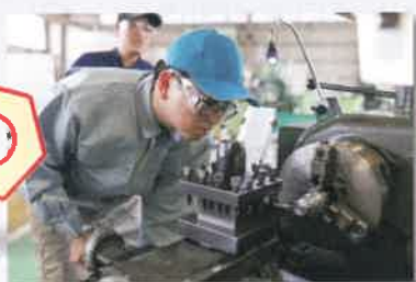
旋盤及びフライス盤作業