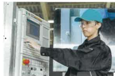
パソコンで設計したデータを、材料に合わせた専用の機械で製造します