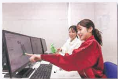
機械製図及びCAD基本