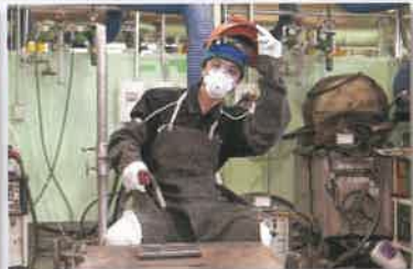
ガス溶接・炭酸ガスアーク溶接