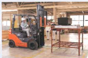
フォークリフト作業