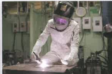
TIG (ティグ) 溶接