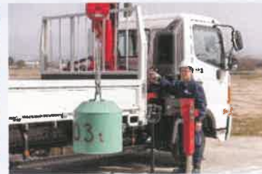
クレーン・玉掛け作業