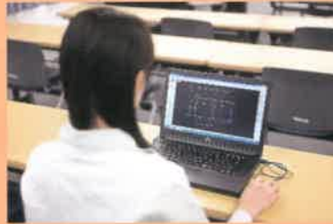
特別教育 電気設備CAD