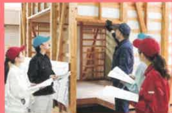
住宅工事管理と躯体・ 内装施工