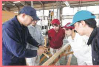
構造部材加工基本技術