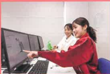
住宅改修計画・ 3次元プレゼンテーション