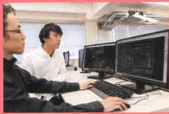
住宅図面作製技術