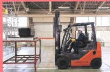
リフォーム施工及び 構造物運搬作業