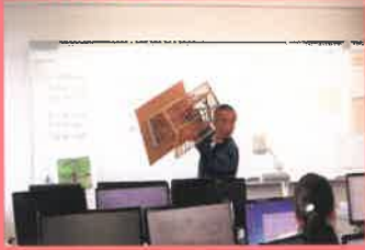
住宅構造・ 法規と申請業務