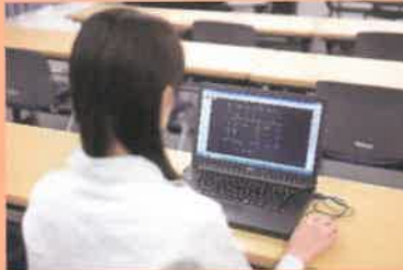
特別教育 電気設備CAD