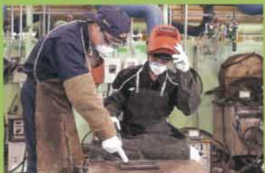
炭酸ガスアーク溶接作業・工作基本