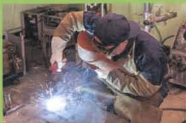
被覆アーク溶接・クレーン運転作業