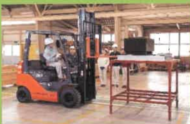
フォークリフト・動力プレス