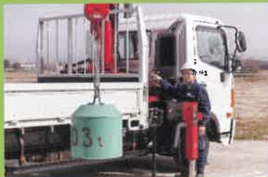
小型移動式クレーン・玉掛け作業