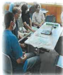
色々な介護事業所の 仕事内容について 直接お話が聞けます