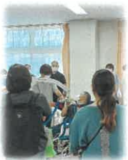
施設見学や 施設実習があります