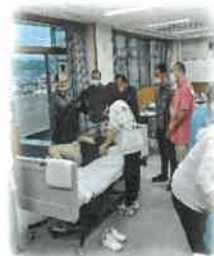
実技はゆっくり丁寧に 教えてもらえます