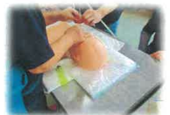
医療的ケアも学べます できるまでしっかり 教えてもらえます