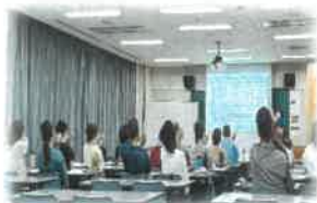
レクリエーションの 技術も学べます