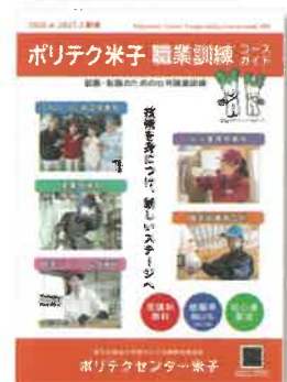
「職業訓練コースガイド」