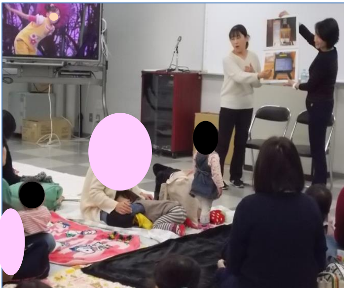
お子様たちも熱心に受講中

実際の園の様子を写真で紹介しながら、 登園後のスケジュールや、毎日用意する ものなど詳しくお話しをしていただきました。 初めて見る園の様子に皆さん興味深々の 様子。質問コーナーでは、実際に不安に 思っていることや、入園までに必要な事な ど具体的な内容を確認されたりする姿が 見られました。