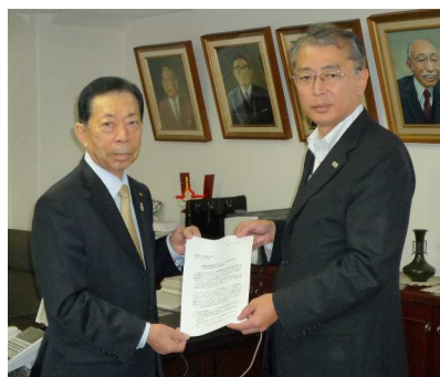
東京都中小企業団体中央会・大村会長(左)に、 要請書を手交する渡延労働局長(右)