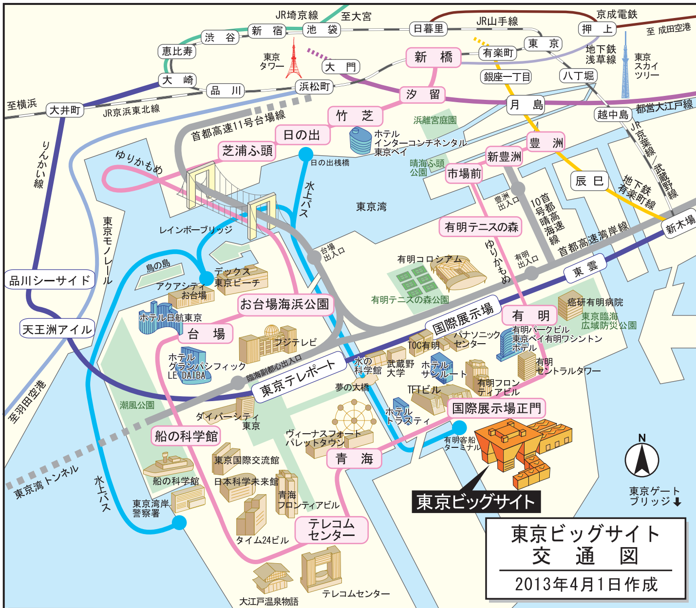
東京ビッグサイト 交通図 2013年4月1日作成