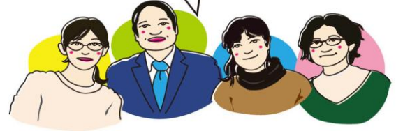
フェリカ TA スタッフ

フェリカの感染防止対策の取り組み 「消毒液設置」「小まめな換気」「会話の際マスク着用の推奨」 安心して教室に来てください！！