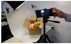
↑ステール撮影実習