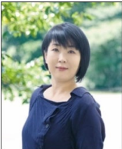
↑現役Webクリエイター

講師陣は、Webデザイナー、映像ディレクター、Webコンサルタントなど、第一線で活躍するプロフェッショナルぞろい。