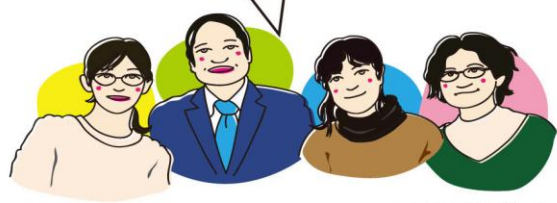
フェリカTAスタッフ

フェリカの感染防止対策の取り組み 「消毒液設置」「小まめな換気」「会話の際マスク着用の推奨」 安心して教室に来てください！！