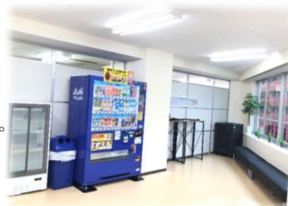
〈 評判の良い休憩室 〉