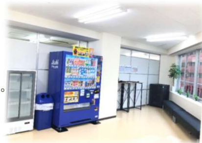
〈 評判の良い休憩室 〉