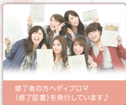
修了者の方へディプロマ (修了証書)を発行しています♪