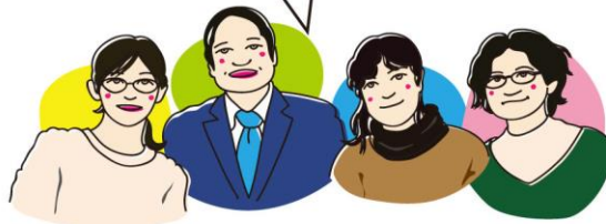
フェリカTAスタッフ

フェリカの感染防止対策の取り組み 「消毒液設置」「小まめな換気」「会話の際マスク着用の推奨」 安心して教室に来てください!!