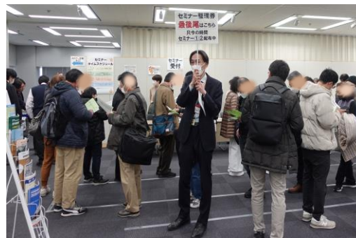
セミナー受付の様子